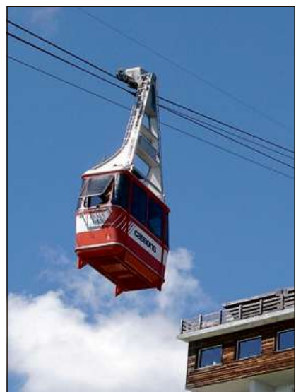
L'avegnir da la pendiculara da Cassons ch'ha stui vegnir spazzada l'onn passà chaschuna vivas discussiuns entaifer la vischnanca da Flem.