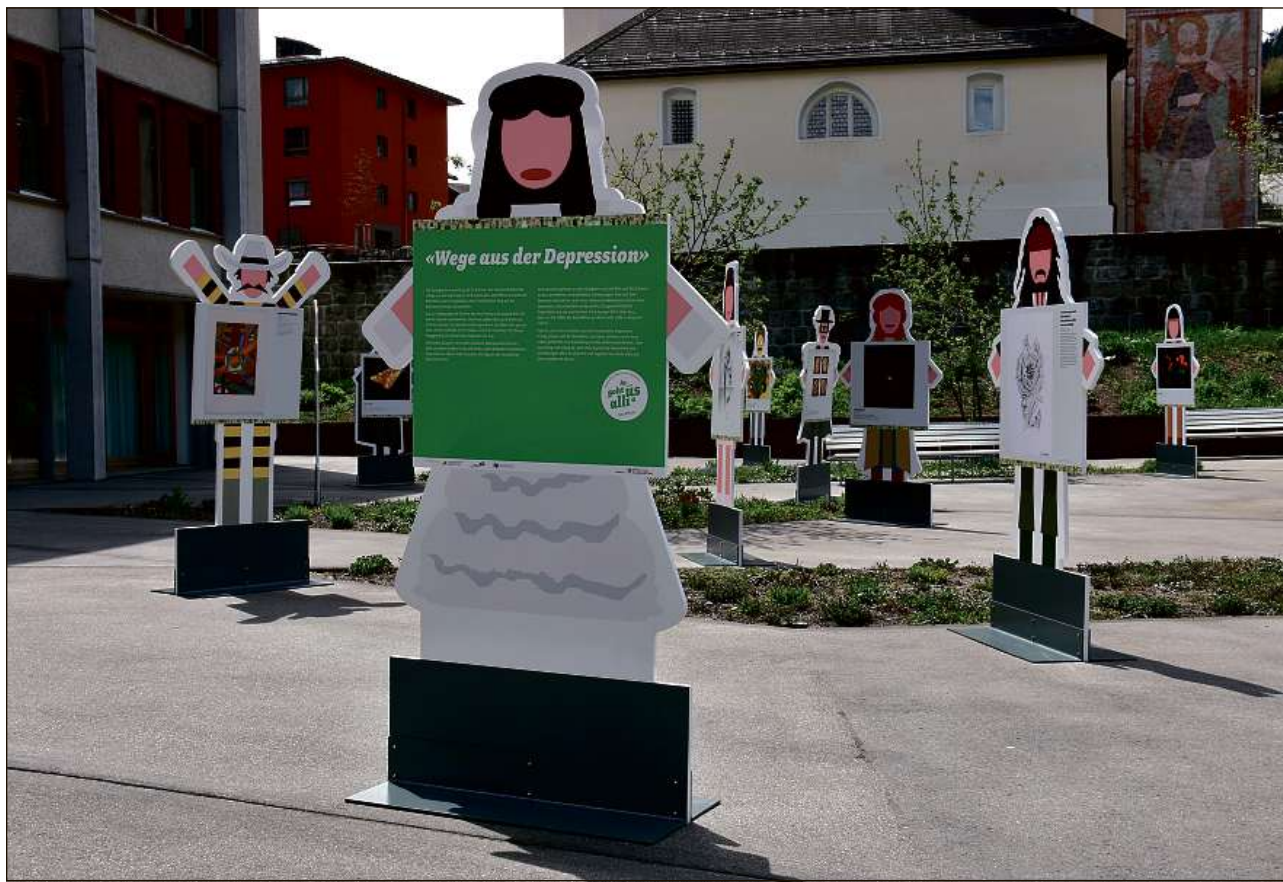
L'exposiziun davart la depressiun sin la piazza da Puntreis a Mustér.

Seigi musicist da rock, cantadura, miedi ni cavalcadra – depressiuns san tuccar e sparter mintgin. Buca tuts piteschan dils medems simtoms. Depressiuns han biaras fatschas. Las figuras dall'exposiziun sin la piazza da Puntreis a Mustér illustreschan quei. Depressiuns s'audan tier las malsognas fetg derasadas ed en lur difficultads s'audan ellas tier las malsognas che vegnan sutschazegiadas il pli fetg. Ina da tschun persunas vegn confruntada silmeins in ga ella veta cun depressiuns che duessen vegnir tractadas. La stigmatizaziun sociala da malsognas psichicas ha denton per consequenza che mo la mesadad dils pertuccai tscherca agid professunal. Ina depressiun che vegn buca constatada e tractada sa caschunar gronds fastedis alla pertuccada ni al pertuccau sco era allas persunas che vivan en siu contuorn. Ella sa schizun periclar la veta. L'exposiziun ambulonta ch'ei vegnida presentada l'emprema ga igl onn vargau a Cuera less sensibilisar la glicud per la malsogna dalla depressiun e mussar ch'igl ei impurtont ed endretg da plidar aviartamein davart la sanadad e las malsognas psichicas. Medemamein vul ella animar d'impedir pregiudezis, pertgei la depressiun pertucca l'entira societad. L'exposiziun sa vegnir